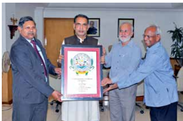
The University logo being released by Shri Radha Mohan Singh, Hon'ble Union Agriculture Minister

agriculture and allied sciences in a holistic and sustainable manner, the year of establishment of the university and its Motto “कृषि सर्व जीवनस्य आधारम्” (Agriculture is basis for sustenance of life.)