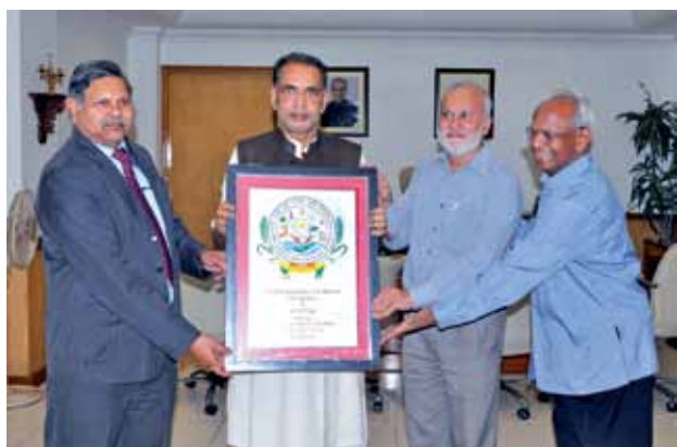
The University logo being released by Shri Radha Mohan Singh, Hon'ble Union Agriculture Minister

agriculture and allied sciences in a holistic and sustainable manner, the year of establishment of the university and its Motto “कृषि सर्व जीवनस्य आधारम्” (Agriculture is basis for sustenance of life.)