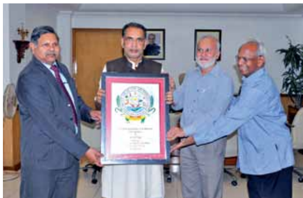
माननीय केन्द्रीय कृषि मंत्री श्री राधा मोहन सिंह द्वारा विश्वविद्यालय प्रतीक चिह्न का विमोचन

विश्वविद्यालय के प्रतीक चिह्न का विमोचन किया। इस प्रतीक चिह्न में कृषि तथा सम्बद्ध विज्ञानों के विभिन्न पहलू सम्पूर्ण और टिकाऊ रूप में दर्शाए गए हैं तथा साथ ही विश्वविद्यालय की स्थापना के वर्ष का भी उल्लेख है। इसका आदर्श वाक्य 'कृषि सर्व जीवनस्य आधारम्' (कृषि सभी के जीवन का आधार है) है।